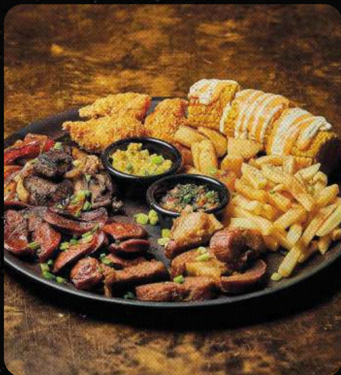
PICADA DE LA TIERRA